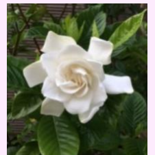
くちなしの花 梅雨時の甘い香りを漂わせます